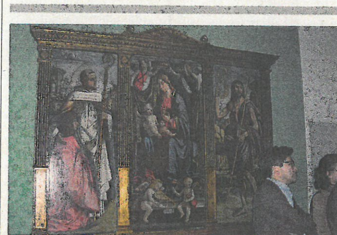
Nel Museo arte sacra ma anche collezioni civiche

Domani alle 21, al Teatro Civico di Tortona, «Giovani voci in concerto per il compleanno della Croce rossa», spettacolo in occasione dei 150 anni dalla nascita della Cri, con il Kinder Chorus Paolo Perduca. Ingresso a offerta. Info: Cri, comitato di Tortona, corso della Repubblica 31, tel. 0131 8294, critortona@gmail.com. [M. T. M.]